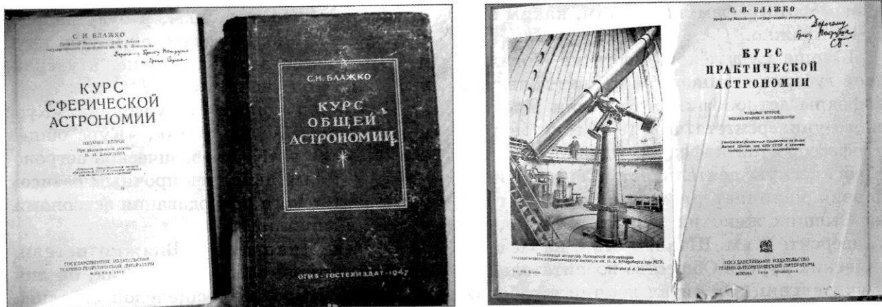
Учебники по астрономии с подписью С. Н. Блажко (экспонаты музея СП № 1 г. п. Хотимска)

досия), прибором собственной конструкции сфотографировал солнечную корону в поляризованном свете.