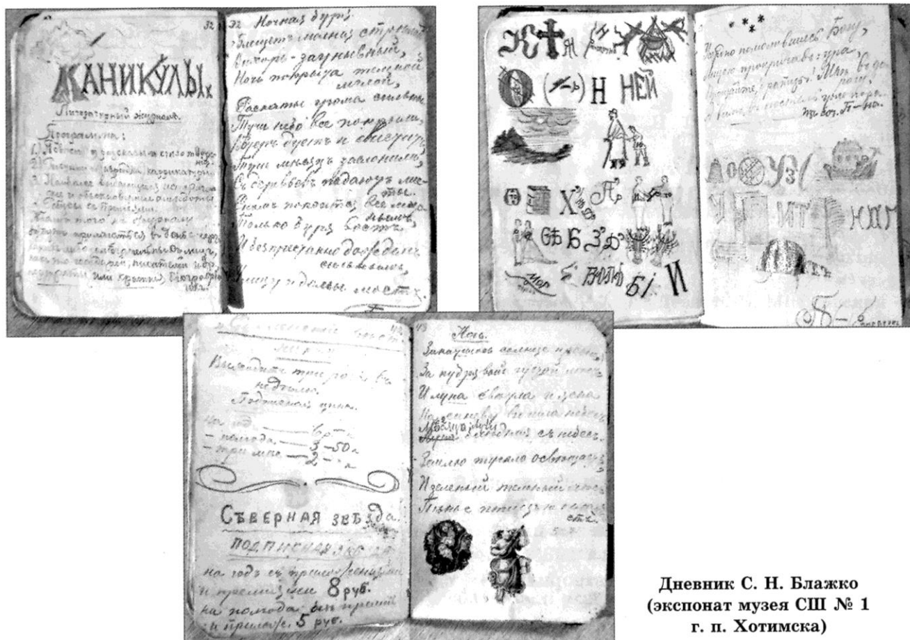
Дневник С. Н. Блажко (экспонат музея СШ № 1 г. п. Хотимска)

Начиная с 1895 года С. Н. Блажко систематически фотографировал звёздное небо с целью обнаружения переменных звёзд, чем положил начало богатой коллекции «стеклянной библиотеки» Московской обсерватории, т. е. собранию негативов звёздных фотографий, на которых было зафиксировано состояние звёздного неба за период 1895—1944 гг. Впервые он проанализировал влияние потемнения к краю диска звезды на форму кривой блеска и на определение элементов орбиты, указал метод учёта этого эффекта. Обнаружил изменения периодов и формы кривой блеска ряда короткопериодических переменных звёзд. Эти явления носят название «эффект Блажко».