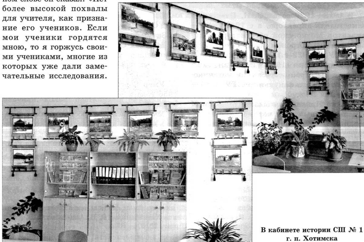
В кабинете истории США № 1 г. п. Хотимска